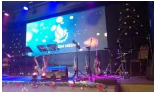
Gambar 2. Tata Letak Panggung

informasi berupa tema, judul karya yang disajikan dan elemen sesuai yang mendukung karya yang disajikan.