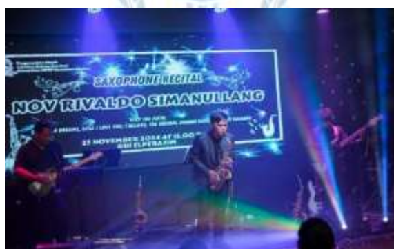
Gambar 3. Penerapan Diaphragm Breathing

Pada saat memainkan saxophone , penulis juga memperhatikan teknik circular breathing , yaitu teknik yang digunakan untuk tetap menghasilkan suara tanpa jeda. Teknik ini dilakukan dengan cara menghirup udara melalui hidung sembari mengeluarkannya dari mulut. Teknik ini dilakukan menggunakan diaphragm breathing , dimana ketika udara mulai habis, penyaji mengisi pipi dengan udara, sehingga dimana saat udara dalam mulut habis penyaji tetap dapat menghasilkan suara menggunakan udara yang tersimpan di pipi. Kunci penggunaan teknik ini adalah mengusahakan menghirup udara dengan cepat dan mulus, dimana saat pipi mulai mengempis, penyaji menarik nafas melalui hidung lalu meniupkan udara dari pipi, sehingga aliran suara tetap berlanjut tanpa jeda.