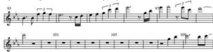
Gambar 5. Penerapan Teknik Altissimo pada Birama 94-99

Teknik altissimo merupakan teknik yang digunakan untuk mencapai nada-nada tinggi. Pada penyajiannya, penulis menggunakan teknik ini untuk mengekspresikan emosi secara mendalam, sehingga dapat menghasilkan kesan dramatis dan meningkatkan intensitas musikalitas penulis dalam melakukan penyajian. Adapun salah satu penerapan teknik altissimo pada karya I Believe terdapat pada bar 94-99 menit ke 3.36-3.47.