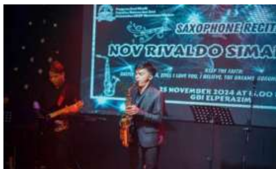
Gambar 4. Penerapan Teknik Circular Breathing