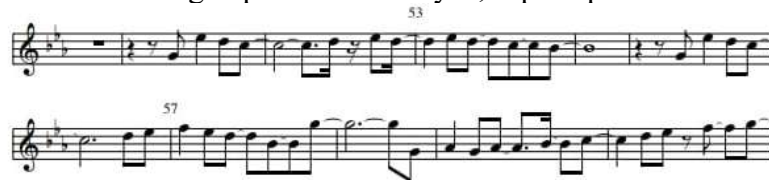
Gambar 6. Penerapan Teknik Tonguing Pada Birama 51-60

Teknik tonguing merupakan teknik yang digunakan untuk memberikan warna dan aksen saat mengeluarkan udara melalui mouthpiece . Pada penyajiannya, penulis menggunakan teknik ini dengan pola “ta” dan “ya”, seperti pada bar 51-60